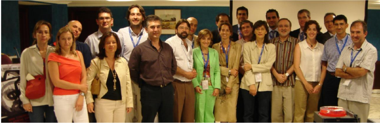
1: Participantes na primeira sessão de Neuroanestesia na Sociedade Espanhola de Anestesia, durante o XXVII Congresso Nacional em Mallorca, 2005.